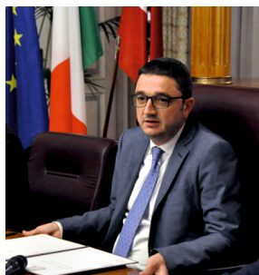
Maurizio Fugatti Presidente Provincia autonoma di Trento

Q uesta edizione 2020 del Festival della Famiglia prende avvio in un particolare momento della nostra comunità e inevitabilmente cerca di interrogarsi sulle questioni poste, con drammatica urgenza, dalla crisi generata dalla pandemia da Covid-19. Una crisi certamente sanitaria, ma con profondi risvolti economici e sociali, che investono direttamente la nostra sfera personale di uomini e donne, costringendoci a modificare abitudini, comportamenti e relazioni affettive.