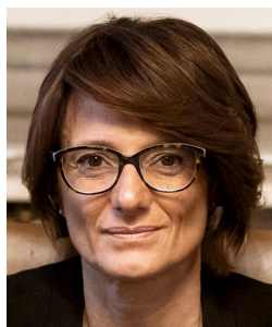
Elena Bonetti Ministra per le pari opportunità e la famiglia

C arissimi, desidero ringraziare ciascuno di Voi per la passione e l'impegno che anche quest'anno animano il Festival della Famiglia.